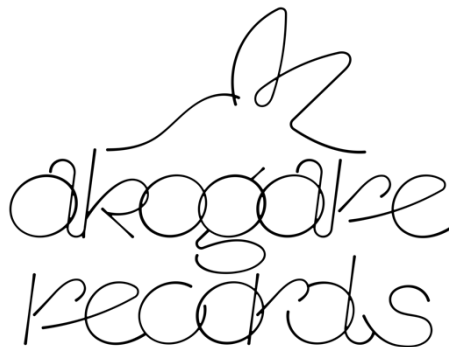
akogare records レーベルロゴ