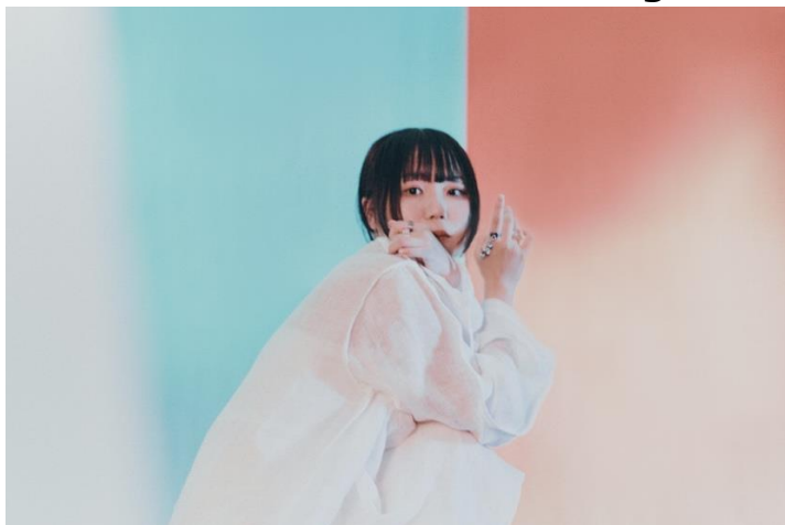
mekakushe 新アーティスト写真